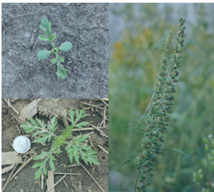
PETITE HERBE À POUX